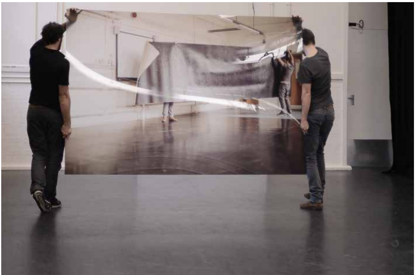
Pétrel | Roumagnac (duo) & SimoKellokumpu, Reset #2 , 2013

(programmateur musique, Fundação de Serralves-Museu de Arte Contemporânea)