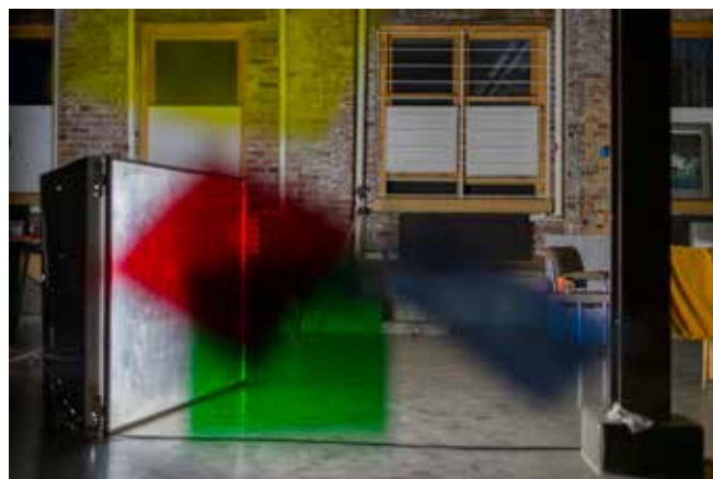
Pétrel | Roumagnac (duo), 201 Full CT Blue (2) , 106 PrimaryRed , 736 Twickenham Green , 101 Yellow , 2017, courtesy des artistes et de la galerie Escougonu-Cetraro