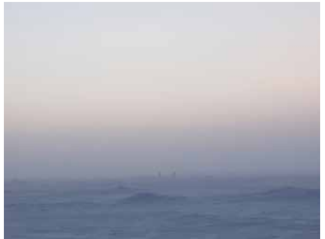
Ellie Ga, Concrete Sea, 2009