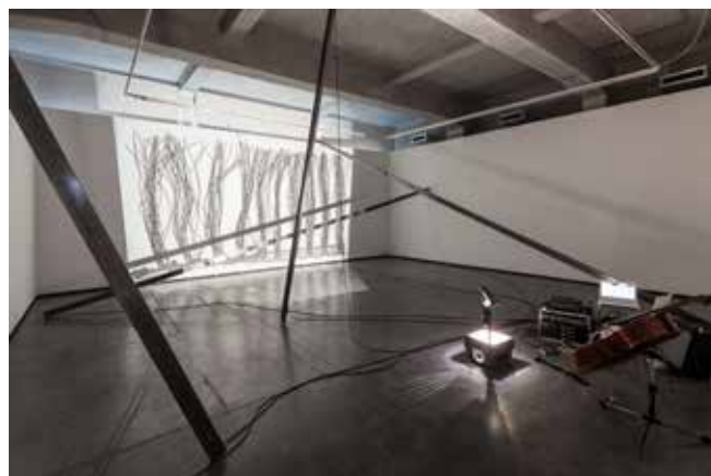
Ricardo Jacinto, Medusa, Segmentos , 2015, courtesy de l'artiste © photo Francisco Nogueira

Une production de ekskena (Croatie) avec le soutien de la fondation Calouste Gulbenkian (Portugal) et MSU (Croatia)